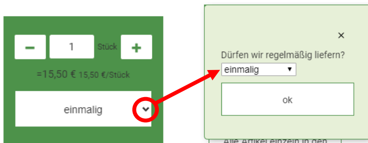
Abbildung 1: Abo hinterlegen

Sie können bei jedem Artikel oder jeder Ökokiste individuell wählen, ob Sie diese einmalig (für den ausgewählten Liefertag) oder dauerhaft für den von Ihnen gewählten Lieferrhythmus erhalten möchten. Haben Sie die Bestellung abgeschickt, sehen Sie Ihre hinterlegten Abos im Profilbereich unter „ Mein Abo “.